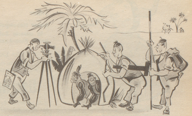
Der Ruf nach billigen Wohnungen. „O, derangieret ech nid, mir möchte nume s Problem vom billige Husbau schtudiere!“