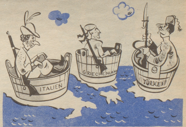
Italien, Griechenland und die Türkei, Mitglieder des Atlantikpaktes E chli öppis vom Atlantik wei mir de glich no um üs ume!

Es glesigs Hüslü würdi de die Kontrolle sehr erlichtere!