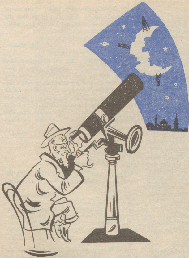
Zukunftsgläubige sehen im Mond ein riesiges Rohstoffreservoir für unsere Erde Was machen sie aus unserem schönen alten Mond?!