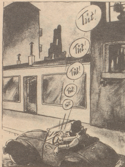
einst Kleine Nachtmusik und Frankfurter Illustrierte jetzt