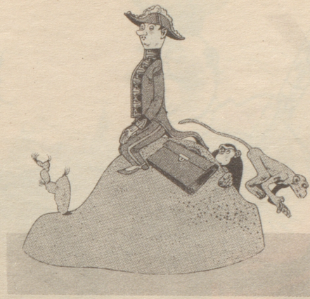
Mehr Gesandtschaften, mehr Attachés

Zu obiger Glosse des Nebelspalters (Nr. 45) schickt uns die Abteilung für Verwaltungsangelegenheiten des Eidgenössischen Politischen Departements folgende launige