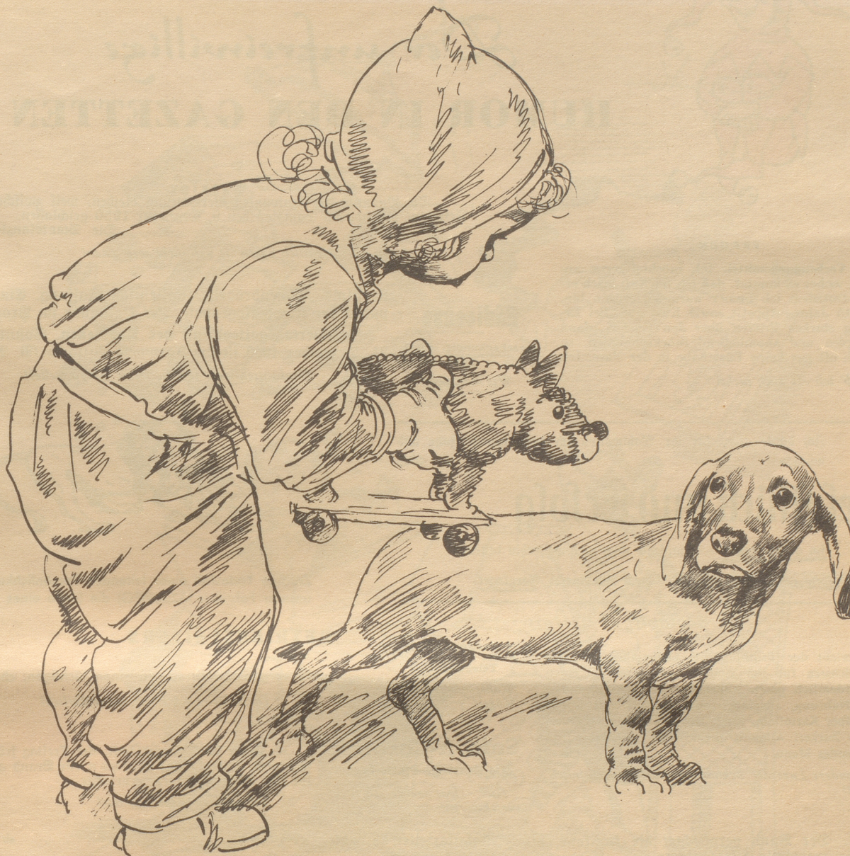
Zeichnung von Robert Högfeldd

Fingern um und um. Ich pirsche mich von ihm weg, wie man vor einem Wohlfäter davonschleicht.