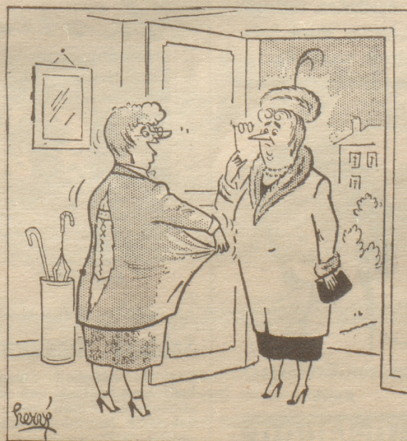
«Und was für eine Regierung! Schauen Sie nur, wie ich gemagert habe! ...» France Dimanche

In der ganzen, löblichen Eidgenossenschaft gibt es todsicher keine so gloriosen Küchen wie die im «Journal». Dort zeigen sie nun schon seit Jahren, was man aus der alten, unmodernen Küche — Bild siehe unten links — machen könne, und wie wenig es koste und wie rassig es nachher aussehe. Richte ich meinen Blick auf «unten links», dann erstarrt meine Seele und meinem blossen Mund entringt sich ächzend: «Wenn meine Küche auch nur halb so schön wäre wie diese, die sie da umorgeln — meinem Schöpfer und dem Hausmeister würde ich chneuligen danken!» Aber ich weiß schon heute: Nie werde ich mich nach einem solchen Dankesakt mühselig wieder auf meine Füße stellen müssen — dafür brauche ich gar keinen Kummer zu haben. Und nie wird aus unserem Badezimmer mit der schitternden Badewanne, die dazu noch dort steht, wo sie am meisten Platz versperrt und mit nichts einigermaßen zu maskieren ist, auch nur ein schwacher Abklatsch jener Gemächer werden, mit