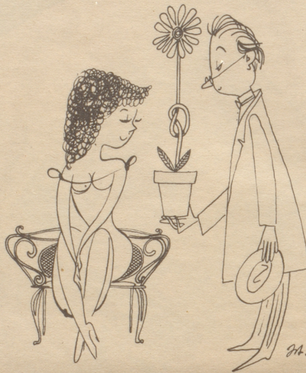
Vergiß mich nicht!

schablone nicht genug tun. Sie werfen dem Zürcher vor, er sei ein «Schnörri». Diese Schablone ist so alt und so dumm wie diejenige vom Thurgauer, der ein Angehöriger der Langfingerzunft sei, oder vom Berner, der das Schnecken-tempo im Blut habe und sich mit einem Kranz zum Hinschied Andreas Hofers