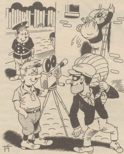
Der Trick mit der Filmkamera

«Haben Sie wirklich einmal Kühe ge- hütet, ehe Sie Schriftsteller wurden?» wurde Mark Twain einmal herablassend gefragt. «Gewiß», antwortete er, «seit da- mals erkenne ich jedes Rindvieh schon von weitem.»