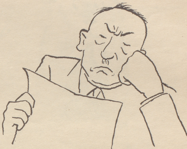
Die zweite Atombombe zur Explosion gebracht!!