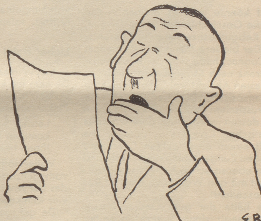
und wieder eine.