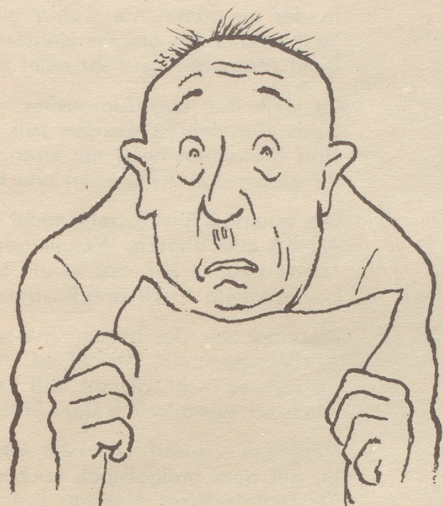
Die erste Atombombe zur Explosion gebracht!!!