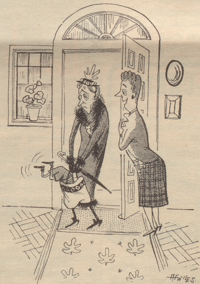
„Säg grüezi dr Großmuetter; es hed kä Bombo i dr Täsche.“ Copyright by «Punch»

Zuschriften und Beiträge für die Frauenseite bitten wir an den Nebelspalter Rorschach, Redaktion «Die Seite der Frau» zu adressieren.