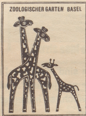
Zoo-Signet — gestern und heute!