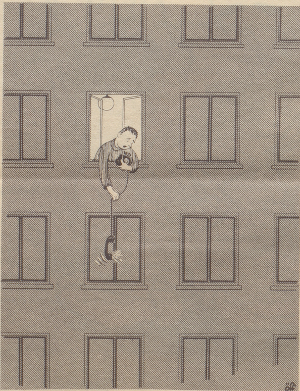
„s isch scho wider für Sie Herr Hueber!“