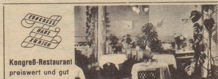
Kongreß-Restaurant preiswert und gut

Ihr Freund empfiehlt: Braustube Hürlimann Zürich am Bahnhofplatz