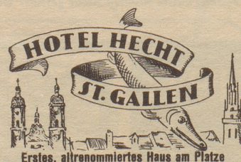
Erstes, altrenommiertes Haus am Platze

In nächster Nummer: Resultat Bildtext-Wettbewerb!