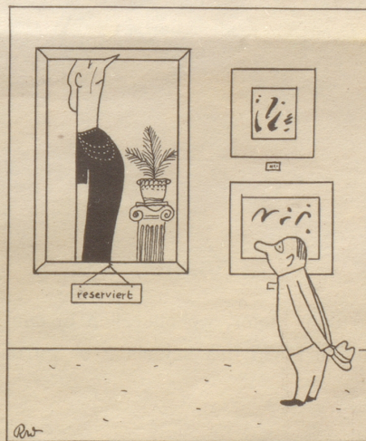
«Allerdings: die Dame gseet sehr reserviert us.»