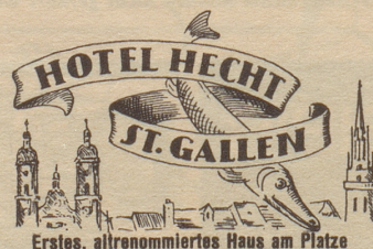
Erstes, altrenommiertes Haus am Platze

In nächster Nummer: Resultat Bildtext-Wettbewerb!