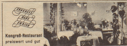
Kongreß-Restaurant preiswert und gut

Ihr Freund empfiehlt: Braustube Hürlimann Zürich am Bahnhofplatz