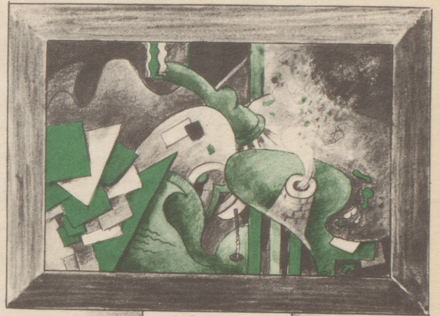
O. Birreweich „Die große Zeit“