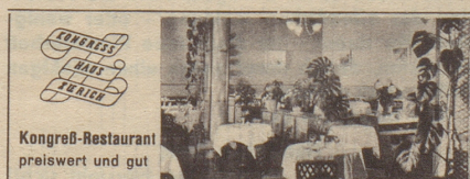
Kongreß-Restaurant preiswert und gut