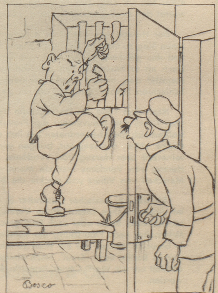
«Wa mache Sii daa?!» «Freiübige!»