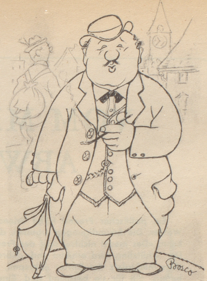
«Nimmt mi nu wunder, werum grad mich allpof en Frönde fröget, wo me hie guet ässi!»

Jetzt muß ich mich aber sicher entschuldigen, wenn ich nochmals auf den besagten Leitartikler zurückkomme. Ich begreife es nämlich schon, wenn einer soviel Poesie und Dichtung in seine Berichterstattung hineinbringt als möglich. Nicht nur wegen der Honorarsteigerung. Poesie ist nämlich bei uns überhaupt sehr geschätzt. Mindestens so sehr wie bei den alten Chinesen, die ja von einem Offizier in erster Linie verlangten, daß er ein schönes Gedicht schreiben könne. Und es ist alles nicht wahr, was man so schwätzt, daß in der Schweiz nur der Ferdi Kübler und der Hugo Koblet bekannt seien. Im Gegenteil, die Dichter und Weisen sind es, die man im hintersten Krachen kennt. Glauben sie's nicht? Thomas Mann hat's erlebt. Als er 1949 auf einer ihm zu Ehren veranstalteten kleinen Landpartie in ein Schweizer Dorf gelangte, kam eine alte Frau – wohlverstanden, irgend eine alte Frau – die von seiner Gegenwart gehört hatte, ganz einfach zu ihm und brachte ihm als Zeichen des Dankes ein Päckchen mit selbstgebackenen 'Kringeln'. Jawohl, so war's, denn so hab' ich es in einer seriösen Zeitschrift gelesen. Und ich finde das etwas sehr Schönes, wenn in einem Land jedes alte Frauli den Thomas Mann kennt und ihm mit selbstgebackenen 'Kringeln' dankt. Wissen möcht ich bloß noch, ob für den 'Doktor Faustus' oder für den 'Zauberberg'.