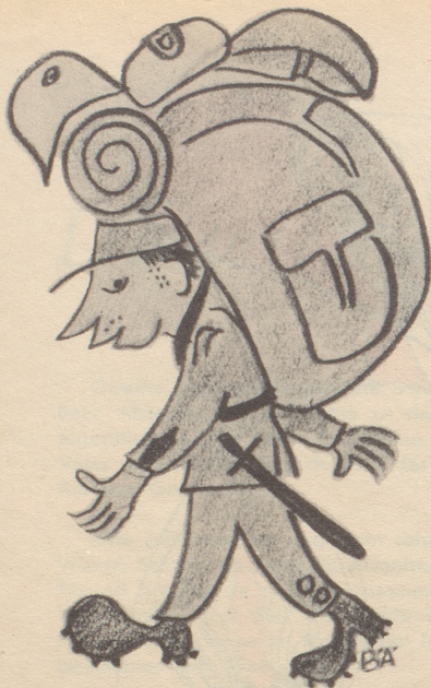
Grüß aus der Rekrutenschule (Karabiner und Patronentasche sind platzhalber weggelassen)