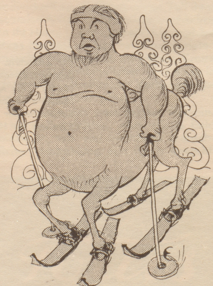
Frei nach Böcklin

Der Besucher kratzte sich mit dem Daumnagel die Kopfhaut und machte ein unentschlossenes Gesicht. «Und das Ding da — die Zeichnung? Ach so — Sie sind ein ganz Gerissener! Jetzt muß