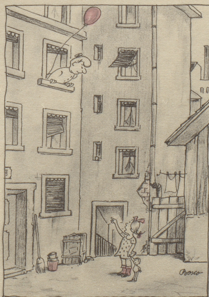
«Mame ghei mr de Luftballon abe!»