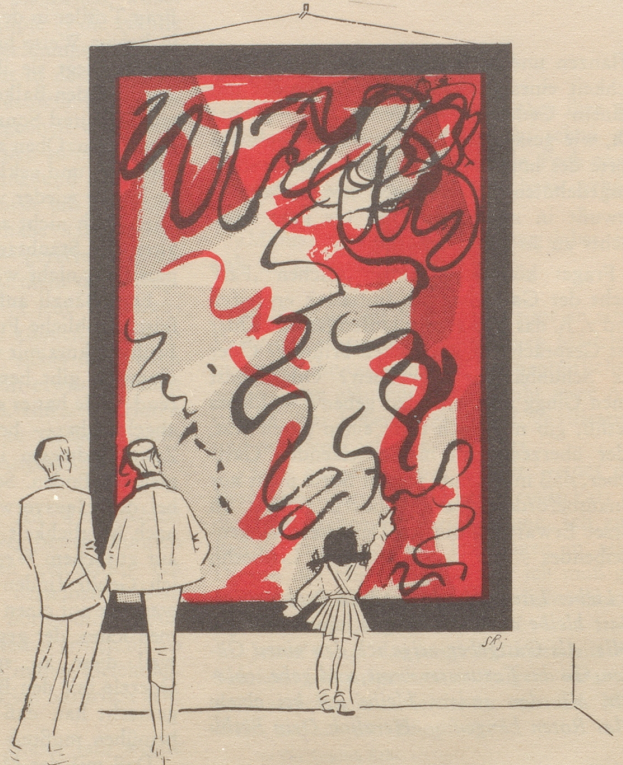
„Ou, da isch er drüber use!“