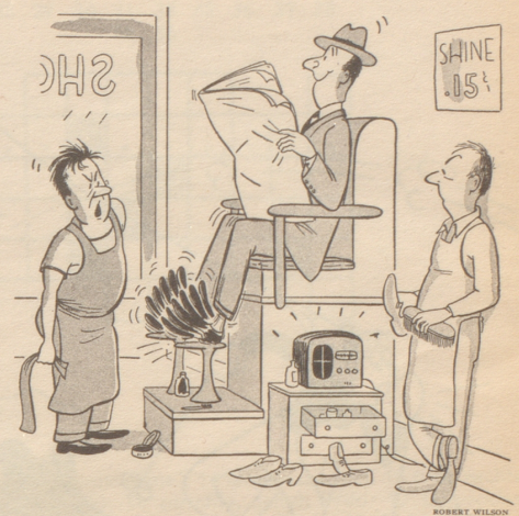
„Stell den Radio einmal für ein paar Minuten ab.“ (Sat. Ev. Post)

Frauen verkörpern das Radio — stets eingestellt auf neueste Nachrichten. Kari