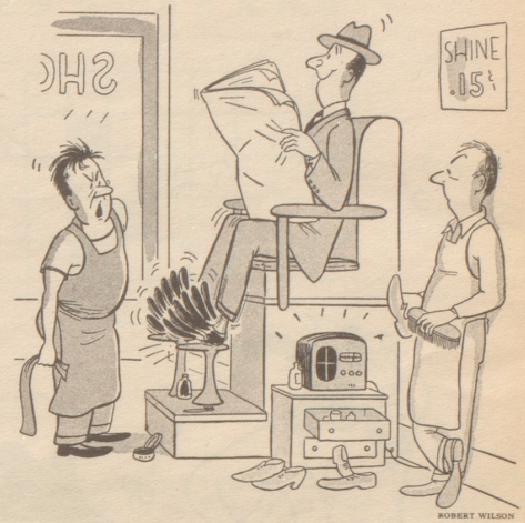
„Stell den Radio einmal für ein paar Minuten ab.“ (Sat. Ev. Post)

Frauen verkörpern das Radio — stets eingestellt auf neueste Nachrichten. Kari