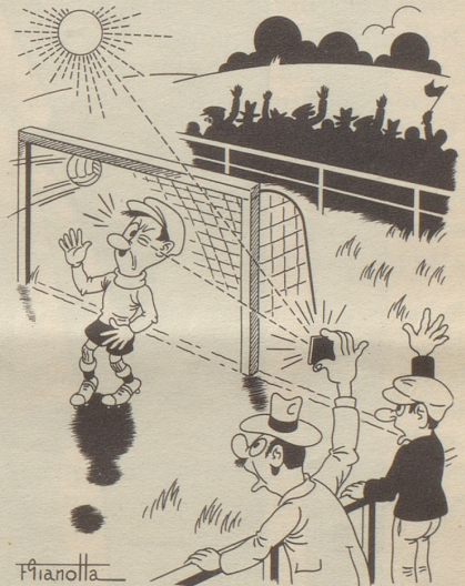
Ein Goal und seine Ursache

Wer kennt nicht die Geschichte von der Matratze! Als man einen Junggesellen, der seinen Haushalt selbst besorgte, fragte, ob er auch alle Morgen seine Matratze kehre, antwortete er: «Säb nöd, aber wenn i si cheer, cheer i si grad zweimol.» Daran wurde ich erinnert, als wir gestern nach dem Nachtessen, wie alle vierzehn Tage, beim Apotheker waren. Das Gespräch kam wieder einmal aufs Frauenstimmrecht. Allgemein war man der Meinung, die Einführung des Frauenstimmrechts sei eine einfache Anstandspflicht. Nur der Apotheker hatte sich noch nicht vernehmen lassen. Man wußte, daß er sich ärgerte, wenn seine Frau ihm vor allen Leuten längliche Reden hielt, wobei man oft nicht recht merkte, was sie eigentlich wollte. Er sagte: «I bi au förs Fraueschtimmrecht. Sogär förs dopplet. Ei Schtimmcharte för de Ma und zwei för dFrau. Scho dMane wössed mengsmol nöd, öb si Jo oder Nei schribe sölled, — ond gär dFraue! Drom wärid zwei Charte ebe gäbig: of eini chönnteds schribe Jo, ond uf di ander Nei. Denn isch allne gholfe. DFraue hend sSchtimmrecht, ond dMane säged wo dore.» MO