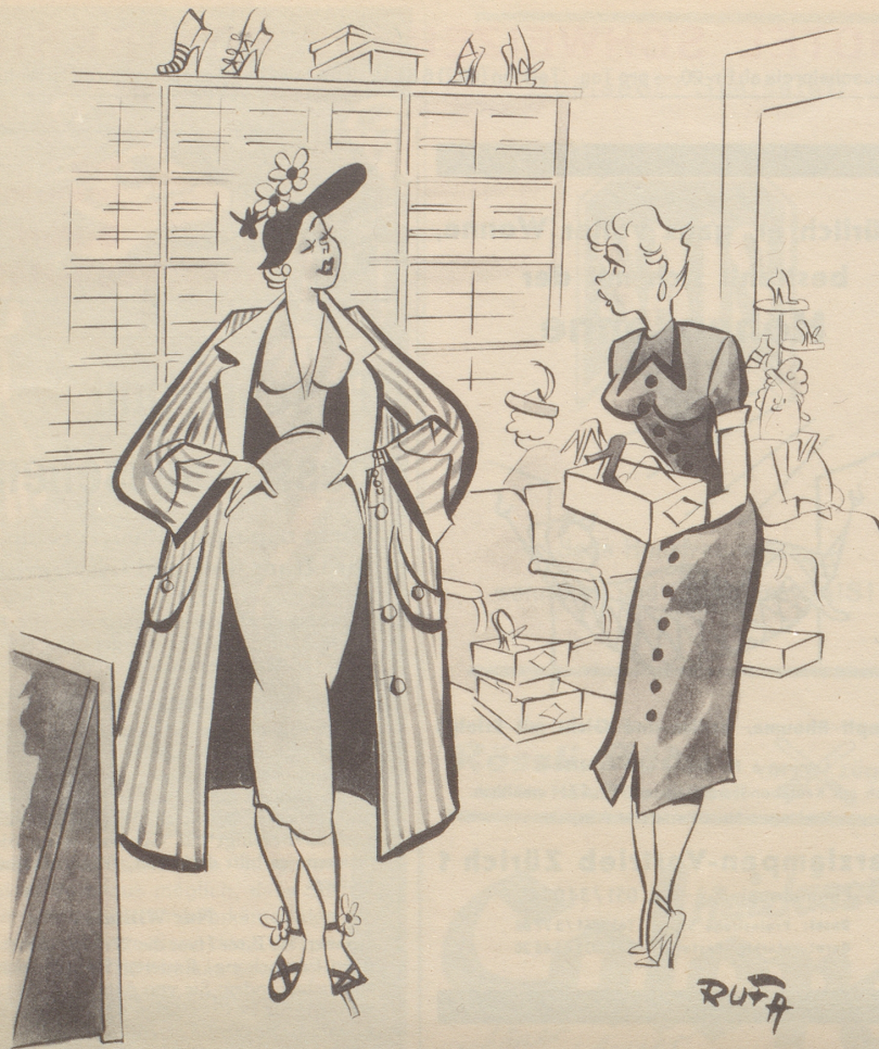
„Die Schüeli passed prezis. Gänzmer die, aber e Nummere chliiner!“