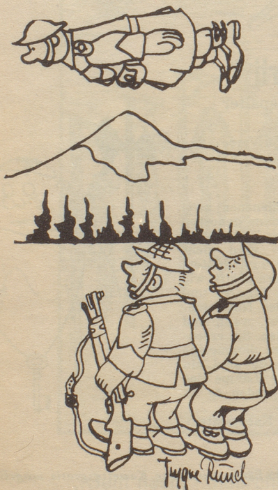
«Ich han ems ja gsait er söll d Uniform nid mit Flugbänzin reinige!» Tyrilians

Vor dem Regierungsgebäude säuberten zwei Männer den Rasen, als ein Windstoß ein Stück Papier vom Boden aufhob, in die Luft wirbelte und es durch das offene Fenster in das Zimmer eines Ministers trieb. Eilig lief der Mann hinterher, kletterte zum Fenster hinauf, kam aber sofort wieder auf den Boden und rief seinem Kollegen zu: «Zu spät, er unterschreibt bereits!»