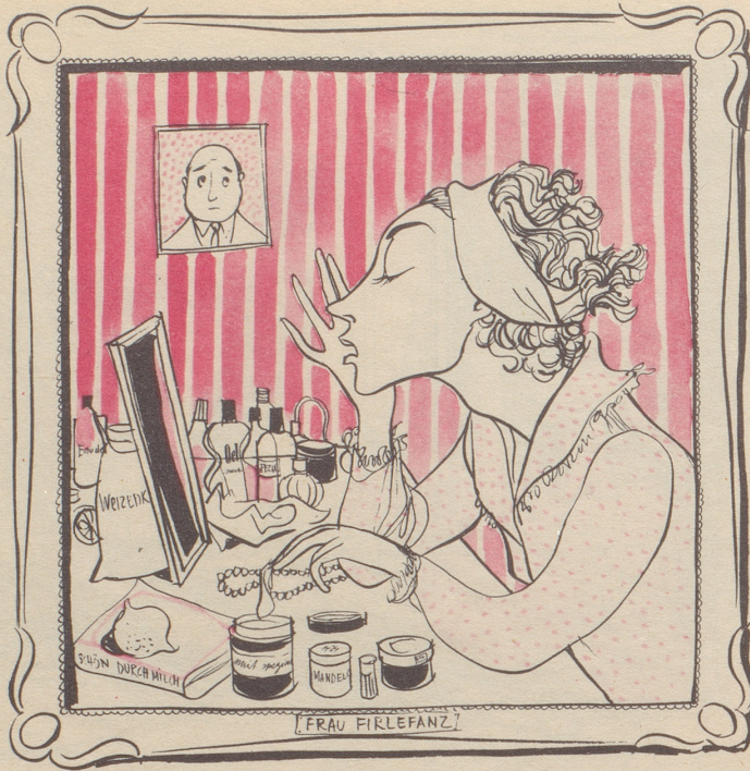
Zeichnung von Alfred Kobel