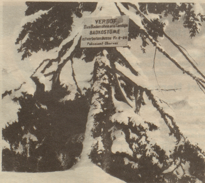
Gestrenge ist das Polizeiamt Obervaz!

Forte stürzt sich der Sopran auf das elegant zugespielte Finale des Alt, das