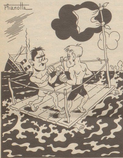
Die schiffbrüchigen Boxer

Senkrecht: 1 Werk, 2 Eile, 3 mg, 4 Nichtig, 5 Hänsel (ae), 6 ist, 7 Trient, 8 Trick, 9 des, 10 am, 11 Trio, 12 Chrom, 13 Etui, 14 Muhme, 15 Opus, 16 Raum, 17 Titan, 18 Grieche, 19 Mode, 20 Menschen, 21 Prafer, 22 Rathaus, 23 Hase, 24 Teer, 25 Emil, 26 Tisch, 27 Knie, 28 Glatz, 29 Mai, 30 BL, 31 grau, 32 Stele, 33 pur, 34 Orient, 35 Titel, 36 Streben, 37 Geselle, 38 Teig, 39 NO, 40 Ruhr.