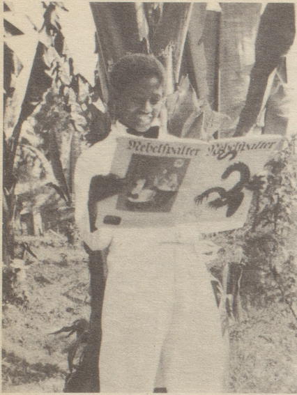
Ein Gruß aus Abessinien

Junger Boy im Kaiserhause Beglückt beguckt er in der Pause Nebihelgen, wildgeformte Weiße Schimmel Bö genormte.