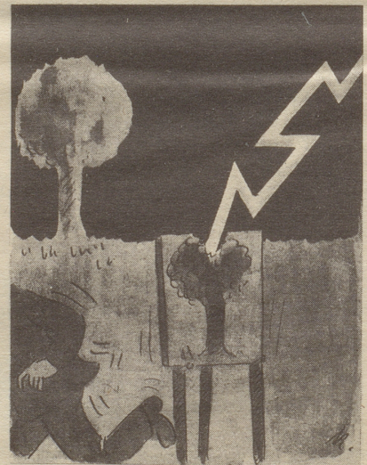
Realismus Söndagsnisse Strix

In einem Papeterieschaufenster las ich «Die Feder, die schreibt wie Sie» und hörte, als ich eintrat, einen kleinen Knaben nach «der Feder, die schreibt wie Vater» fragen. Daß es gerade die Zeit der Zeugnisse war, war natürlich Zufall! SH