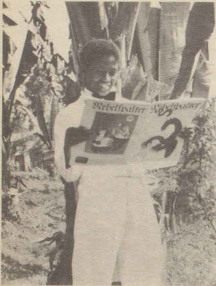
Ein Gruß aus Abessinien

Junger Boy im Kaiserhause Beglückt beguckt er in der Pause Nebihelgen, wildgeformte Weiße Schimmel Bö genormte.