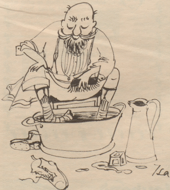
Bade im Frühling mit Vorsicht!

Hier treffen wir nun alle die Bö-Zeichnungen der letzten Jahre wieder, zusammengestellt zu einem Buche des Humors und der Satire. Könnte man es doch allen jenen schenken, die mit einem griesgrämigen, langen Gesicht umhergehen – auch sie würden sich amüsieren und sich wieder aufheitern. «Volksrecht»