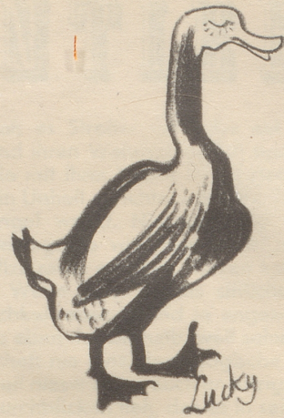
Früh übt sich — —