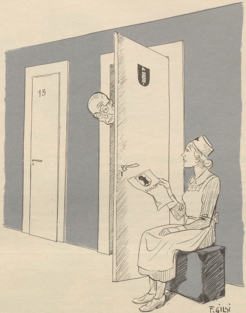
Eine Gemeindeschwester mit dem Basler Hebammen-Diplom durfte im Kanton St. Gallen nicht als Hebamme tätig sein.