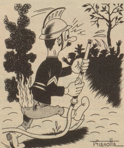
„Wo brännts dänn egetli?“

Als wir im Jahr 1925 nach den Vereinigten Staaten fuhren, herrschte dort noch die Prohibition. Meine Schweizer Mutter hatte uns vorsorglich ein Cognacfläschchen mitgegeben: gegen Seekrankheit. Aber erstens wurden wir nicht seekrank, und zweitens gab es eine Schiffsbar. Als wir im Hafen einfuhren, wurde mir geraten, das Gütterli in die Hüftentasche zu verstecken, allwo es wohlbehalten durchkommen werde. Wir saßen im großen Saal, wo die Passinspektion stattfinden sollte. Auf einmal fühlte ich, wie sich Nässe auf meinem Gesäß verbreitete. Ich stürmte an Deck, kratzte die Scherben aus der Tasche und lief, mit dem Mantel wie ein Vogel um mich schlagend, gegen den Wind. Aber selbst dies half mir nicht. Als ich vor dem Zollbeamten stand, roch ich wie eine Schnapsfabrik. «Passieren Sie», sagte er zwinkernd, nachdem er nichts gefunden hatte, «gegen Ihren Duff haben wir noch kein Gesetz.» GM