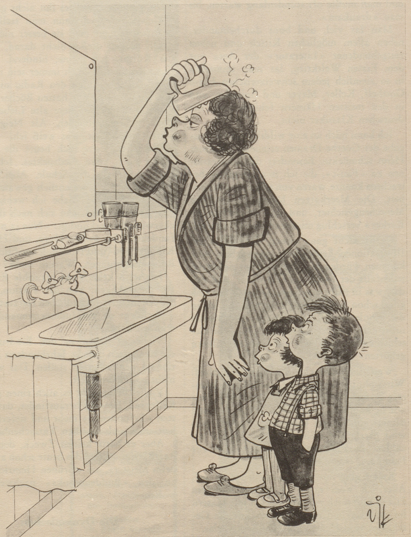
Morgengymnastik Für die Wiener Frühjahrsmesse hat ein Aussteller ein Bügeleisen angemeldet, mit dem man Runzeln aus dem Gesicht bügeln kann.

Das, in etwas variiert Form, passierte mir schon bei den vorhergehenden Suchen.