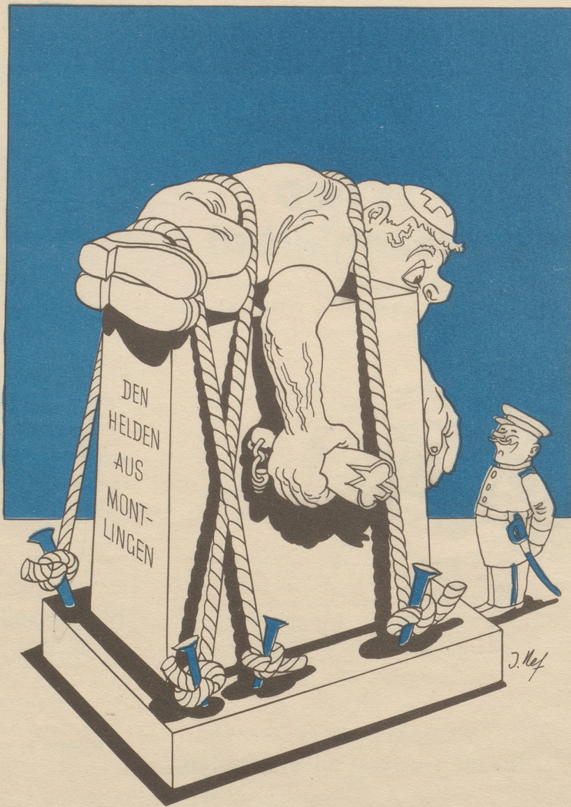
16 Schweizer führten sich in Feldkirch so schlecht auf, daß sie verhaftet werden mußten.