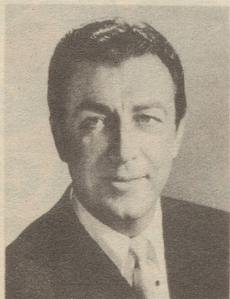
Robert Taylor, Star des MGM-Films «Das grosse Geheimnis» (Above and Beyond)

Wenn Ihre Haarpapillen den Haarboden nicht mehr vollkommen ernähren - wenn Sie unter Schuppen leiden, dann erinnern Sie sich: