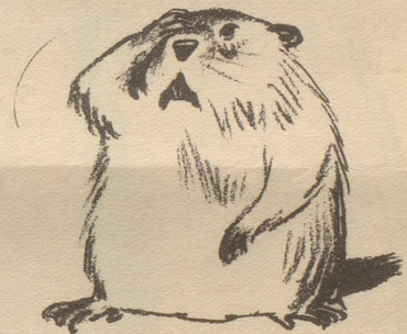
„Du liebi Zyt — en Sässelilift!“ (Giovannetti)