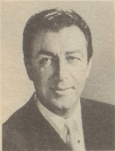
Robert Taylor, Star des MGM-Films «Das grosse Geheimnis» (Above and Beyond)

Wenn Ihre Haarpapillen den Haarboden nicht mehr vollkommen ernähren - wenn Sie unter Schuppen leiden, dann erinnern Sie sich: