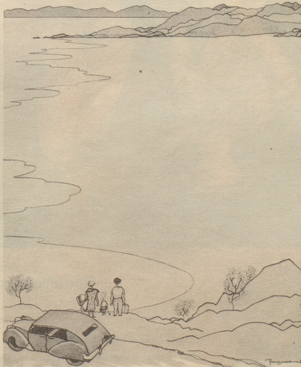
„Schade — es ist schon jemand da!“