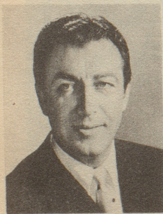
Robert Taylor, Star des MGM-Films «Das grosse Geheimnis» (Above and Beyond)

Wenn Ihre Haarpapillen den Haarboden nicht mehr vollkommen ernähren - wenn Sie unter Schuppen leiden, dann erinnern Sie sich: