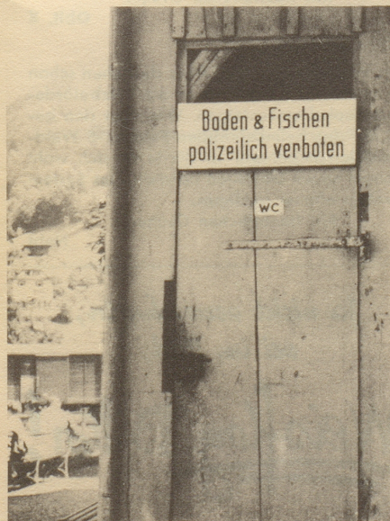
s wird au niemerem iifale!