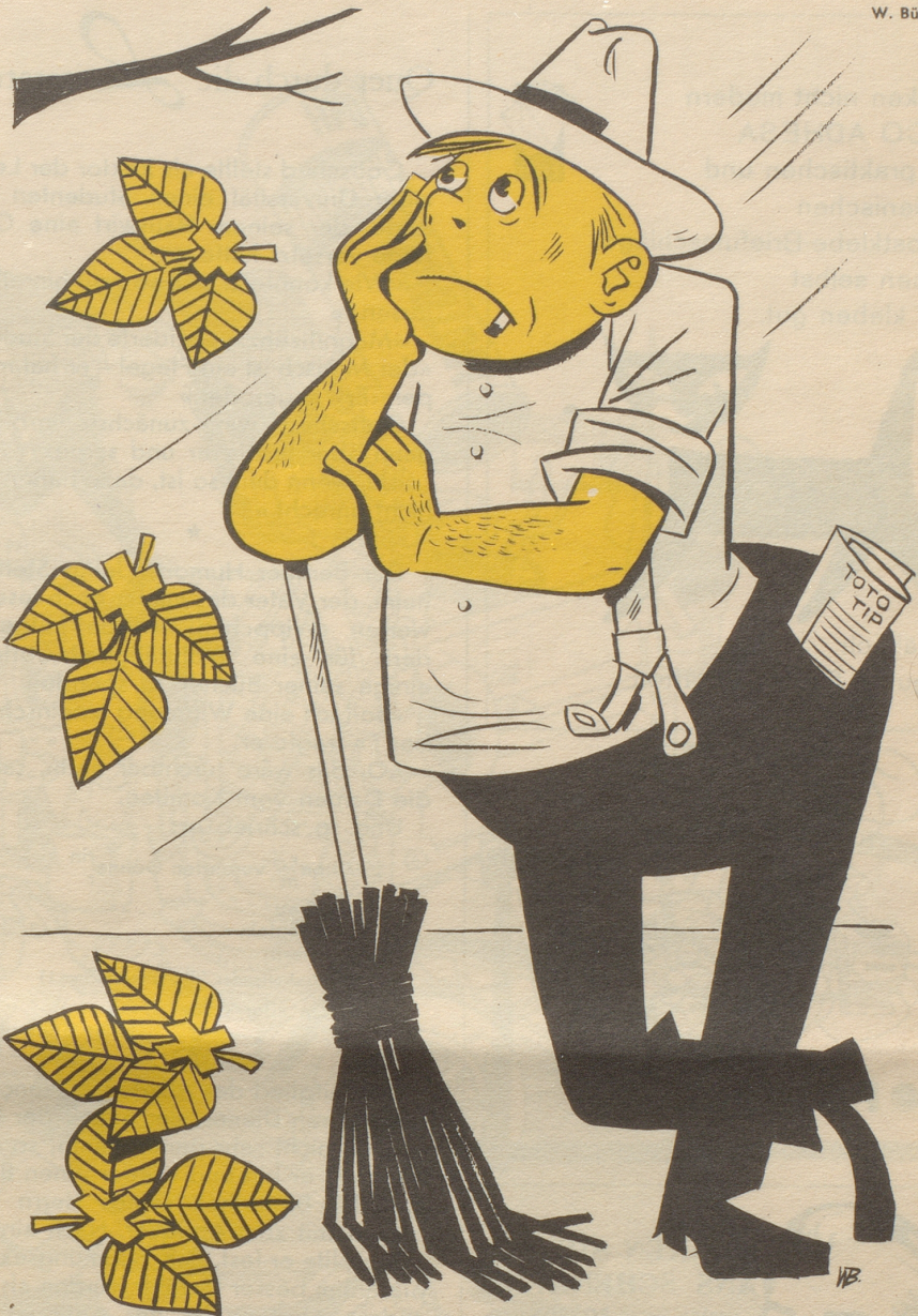
Wegen minimalem Interesse mußte das mit großem Erfolg eingeführte schweizerische Sportabzeichen liquidiert werden.

Also hend miar zwai, dar Giraff und ii, mitanandar dischgariart. Miar zwai, und mit üüs sihhar no a Uuhuufa andari wartand jetz, bis z Bärnar Obargricht dä Fall au aafangt zdischgariara ..! WS