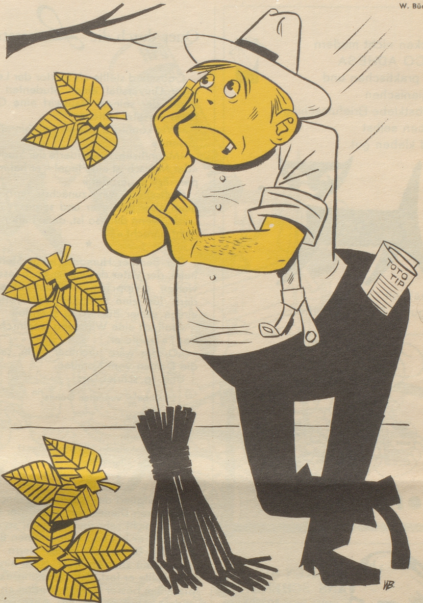
Wegen minimalem Interesse mußte das mit großem Erfolg eingeführte schweizerische Sportabzeichen liquidiert werden.