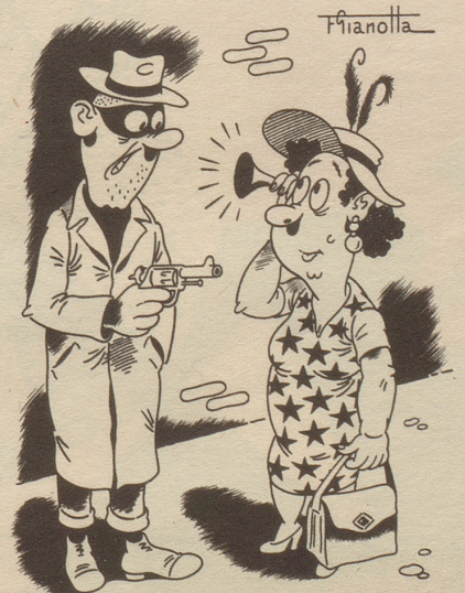
„Sie müend e chli tüütlicher rede – i ghöre schlecht!“