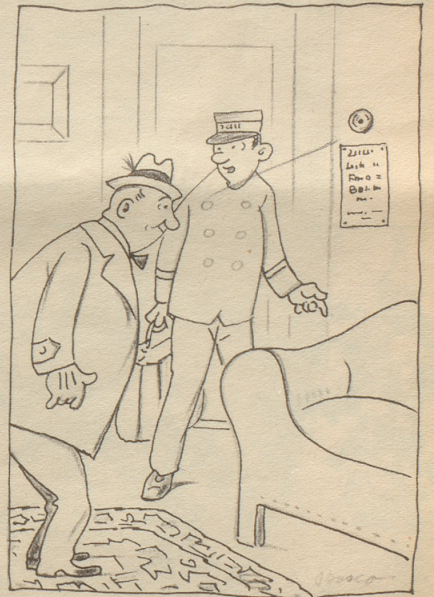
«Uf dem Sofa isch sinerzit de Goethe gsässa.»