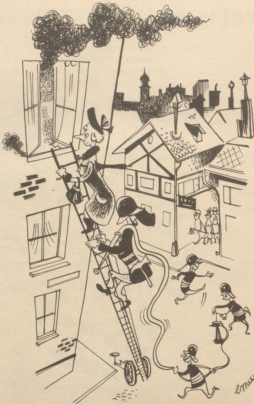
Die besorgte Feuerwehrmannsfrau