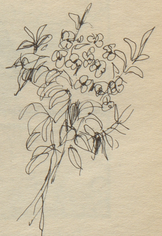
Vignetten von A. Kobel