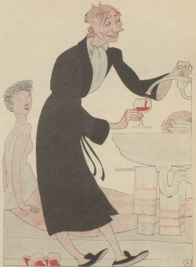
In Dijon fließt in einigen Hotelzimmern aus zwei Hähnen zu jeder Tag und Nachtzeit Rot- und Weißwein.

„Muesch entschuldige Helendli, ich ha glaubi öppis im Hals, ich mues alpot gugurgle!“